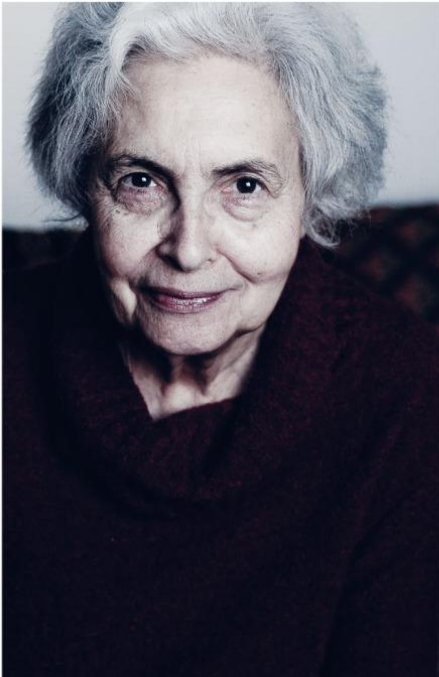
BENEY ZSUZSA | 1930-2006

„Mindent hallani ami egykor lélegzett az időben minden van ami volt de fent de fent a szem sós paraszában él ami nincs”