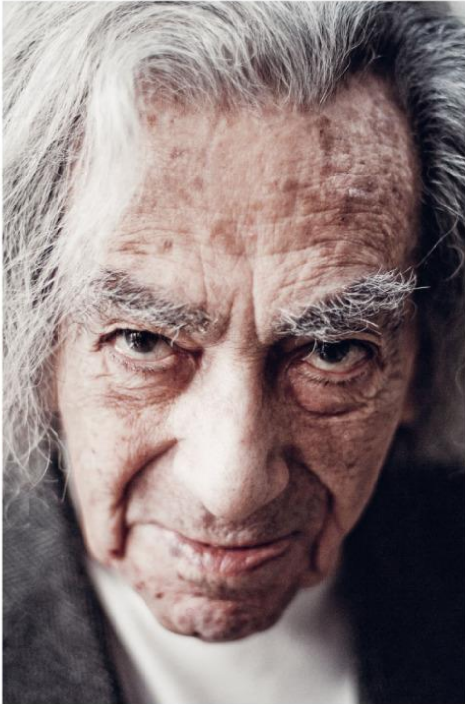
FALUDY GYÖRGY | 1910–2006

„...de csak néző vagyok, csendes, mohó néző – és ez a legnagyobb öröm abból, hogy itt éltem a földön.”