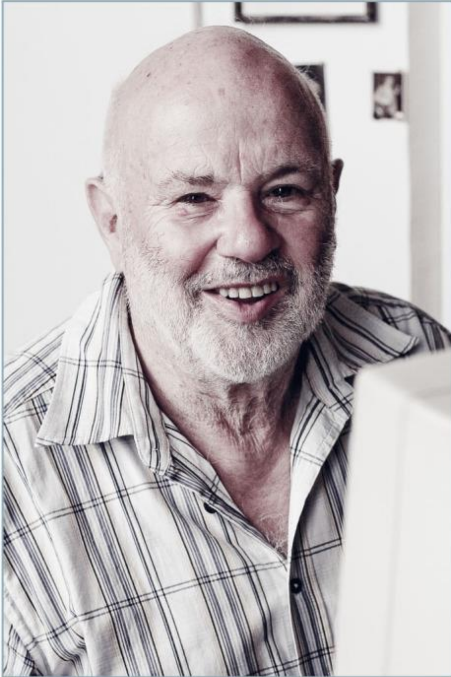
EÖRSI ISTVÁN | 1931-2005

„Elviselhető lesz az elviselhetetlen, de nem lehetséges, ami lehetetlen.”